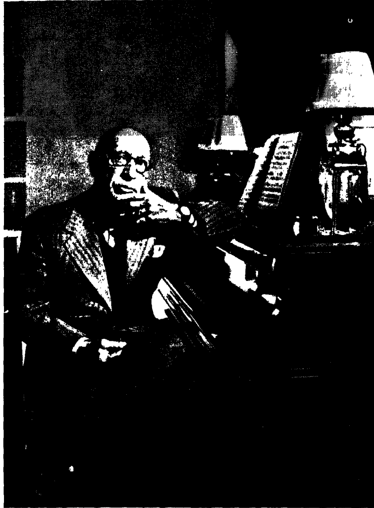
سترافنسكي أمام آلة البيانو ، آتة المفضلة للتأليف الموسيقي